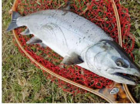
貴重なサクラマス