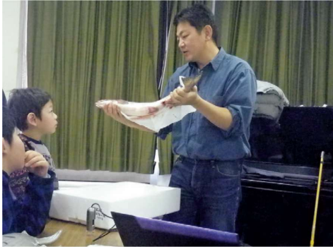
有識者からサクラマスの生態と地域の環境を学ぶ