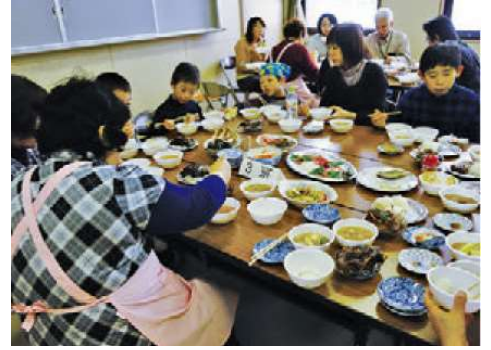
郷土料理を食して地域の文化と価値を知る