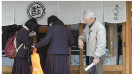
老舗「今川酢造」を訪問、インタビューしました。