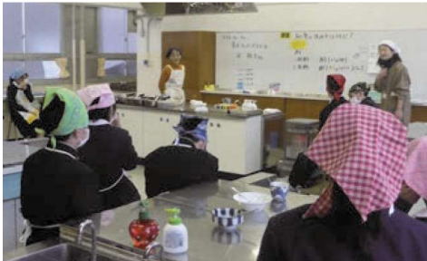
調理実習「和食の決め手はなんだろう？」

施設見学や体験活動(調理実習)、専門家からの話を通して、金沢の食文化を育んだ地域の環境、風土や歴史について学び、理解を深めるとともに、守り伝える意識を育てます。調べ学習や体験活動を通して、地域の伝統を守ることの価値や地域と自分の暮らしのつながり等を理論的、多角的に思考する力、伝統的な金沢の食の良さを確認し、地域の環境、風土、生産と販売、生活者の視点から受け継ぐために自分にできることを考え、実行する力を育みます。